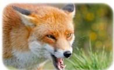
หมาป่ากับกิ้งผอย

เมื่อเศรษฐีรับเงินไปแล้ว พระมหากษัตริย์ตรัสถามเศรษฐีว่า "เมื่อเศรษฐีหยิบเงินค่าตัวของชายยากจนนั้น ชายยากจนก็เห็นท่านหยิบเงิน แต่เขามีส่วนได้รับเงินจากการมองเห็นหรือไม่?" เศรษฐีตอบว่า "ไม่ได้รับเงินจากการมองเห็นพระเจ้าข้า" พระมหากษัตริย์จึงตรัสว่า "ก็เปรียบได้กับอาหารของเศรษฐี ถึงใครจะสูดกลิ่นอาหาร แต่อาหารก็ยังคงเดิมไม่สูญหายไป เพราะฉะนั้นเศรษฐีจะเอาชายยากจนเป็นคนรับใช้ไม่ได้" ทั้งเศรษฐีและชายยากจนก็กลับไปบ้านของตนเองด้วยความยินดี