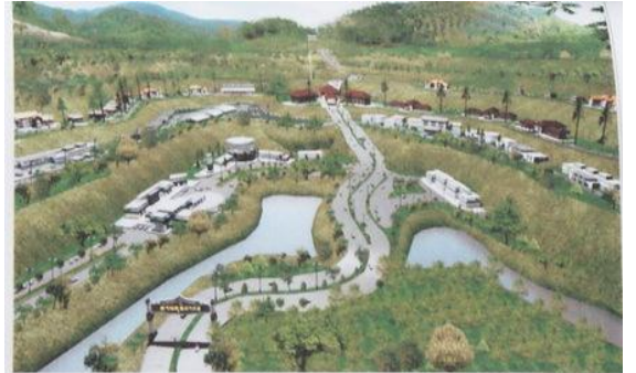
ภาพทัศนียภาพลานชุมชนไทย-พม่า (พุน้ำร้อน)

สำนักงานโครงการพิเศษและสิ่งปลูกสร้างพิเศษ